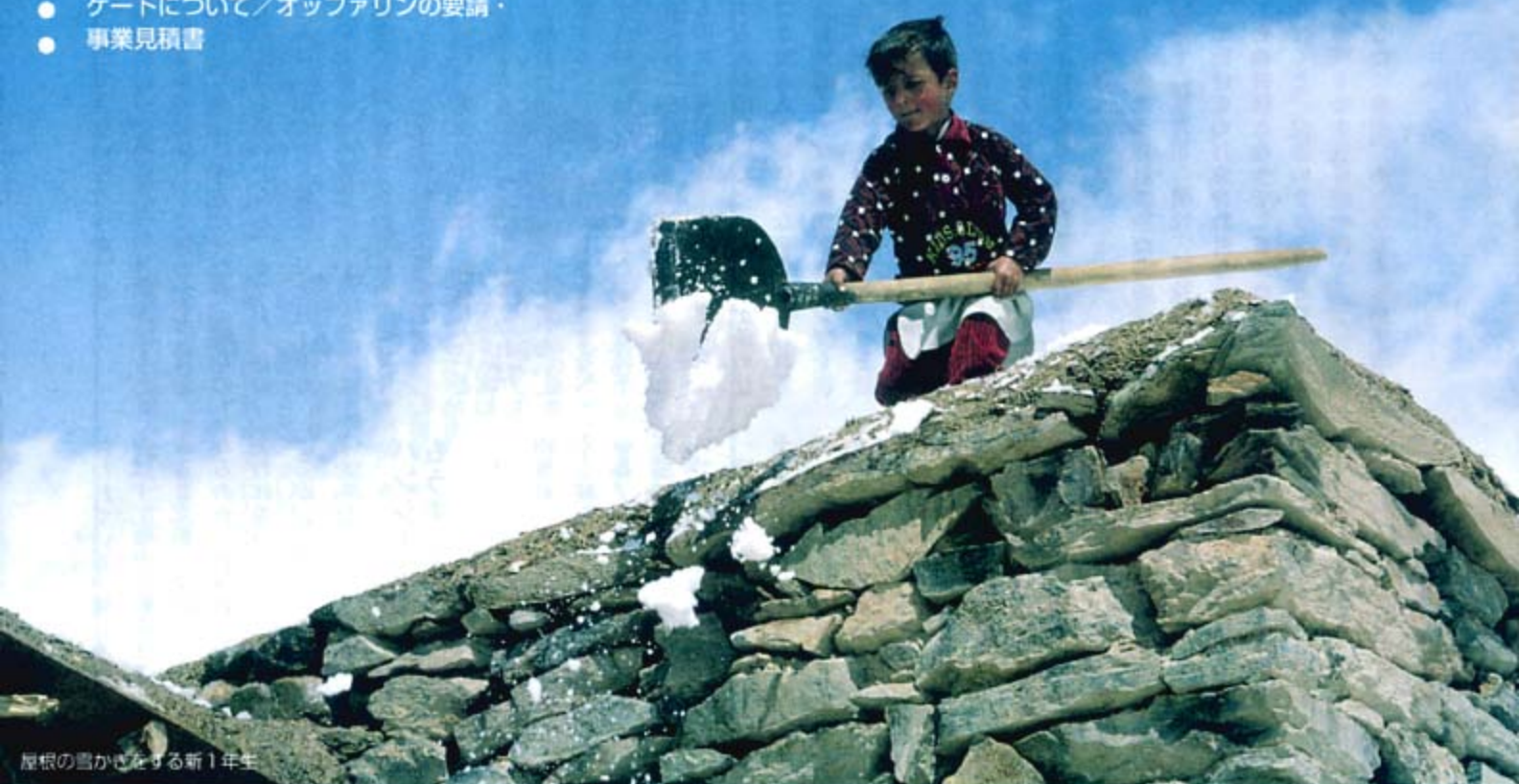
屋根の雪かきをする新1年生

会員の皆様、お元気で過ごしてでしょうか。今年春に行った公式訪問の報告を載せた第5号が出来上がりましたので、皆様にお届けいたします。 山の学校は新入生を迎え、にぎやかな新学期を迎えました。先生と生徒から、「日本の皆さんからの支援に感謝しています。会員の皆さんによりしくお伝えください」という温かいメッセージを預かりました。