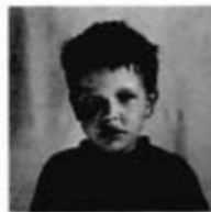
マシワラールくん (6歳) 1年